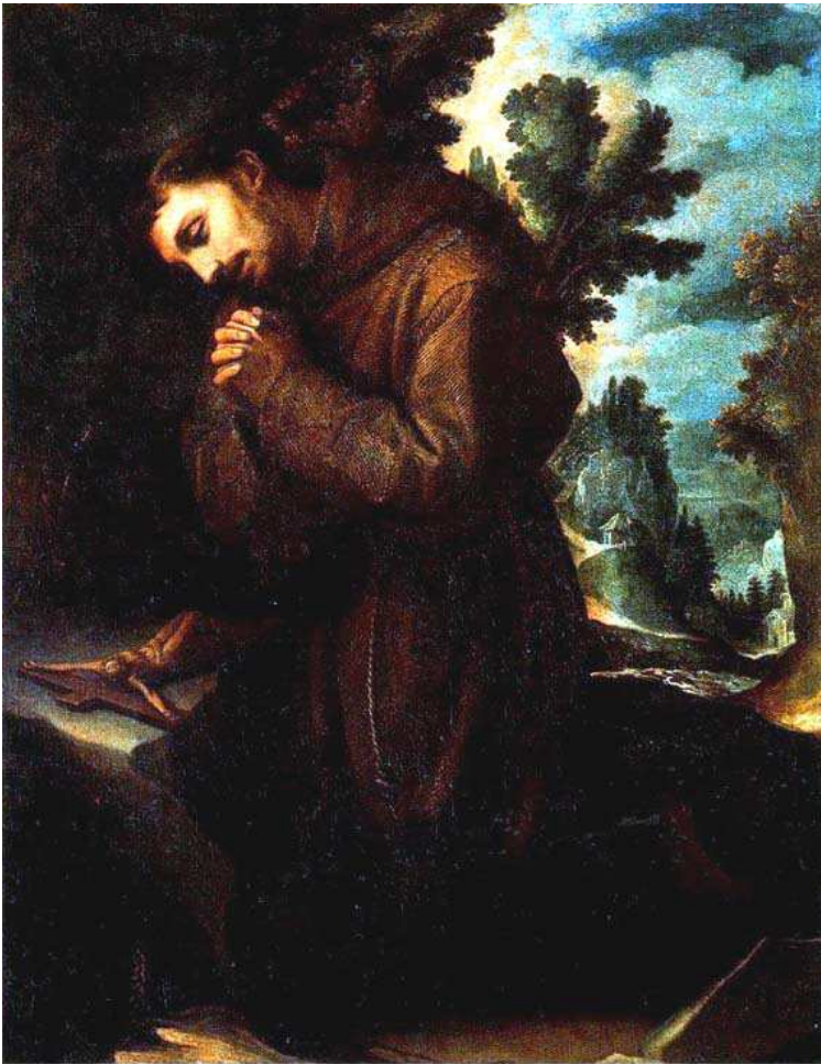
Ludovico Cardi da Cigoli, S. Francesco in preghiera, 1600 c., Galleria Palatina, Palazzo Pitti, Firenze

Noi dobbiamo essere il messaggio vivente. Quando chiedono a san Francesco